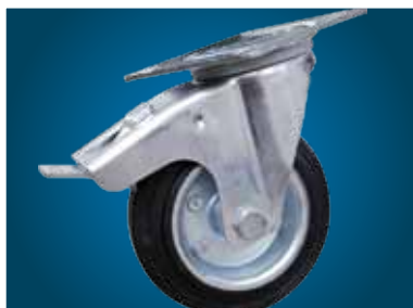
OPTIONAL 4 RUOTE