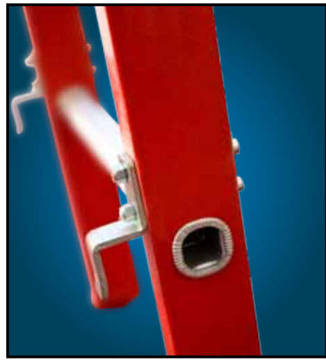
SISTEMA DI AGGANCIAMENTO IN ACCIAIO PER LO SFILÒ