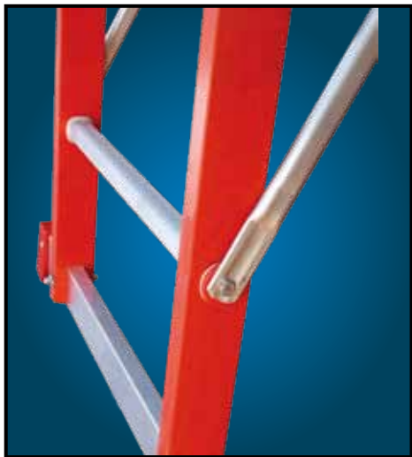
STAFFA permette un aggancio rapido per rendere la scala più salda e sicura.